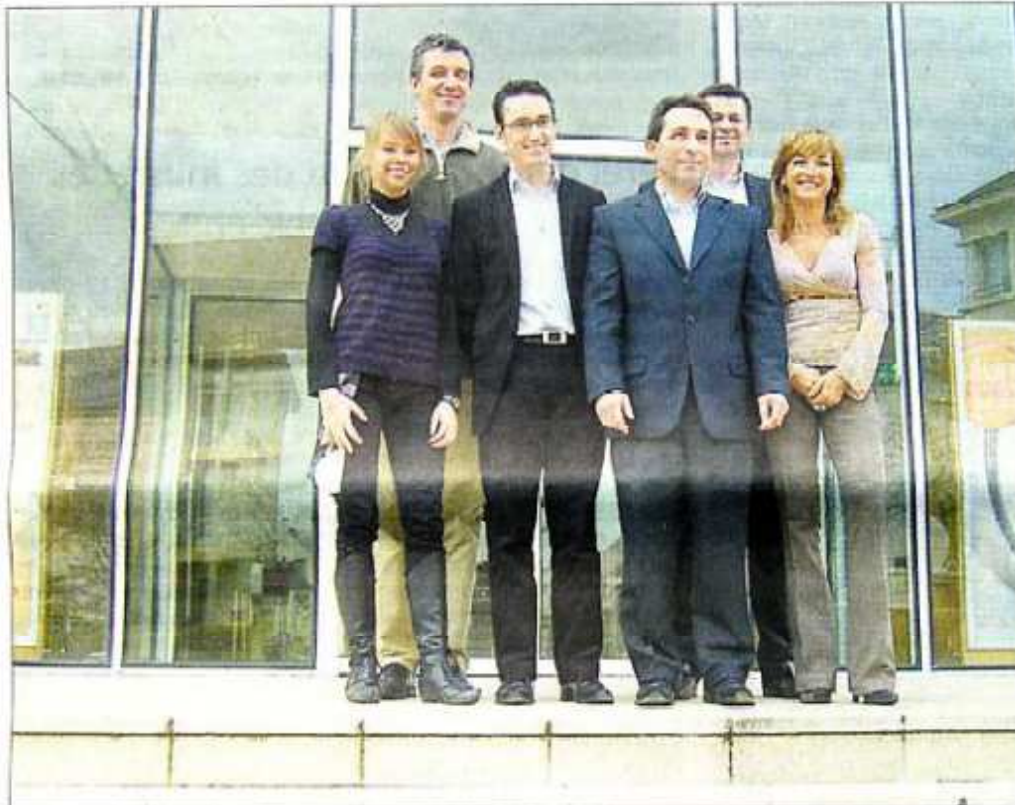
Surfant sur la vague de l'écologie, le thème de ce salon est le développement durable et les entreprises.

Le club d'affaires Atlantique organise pour la cinquième année consécutive un forum des services aux entreprises. Cette année, il aura lieu le jeudi 3 et vendredi 4 avril 2008 à la salle des Floralies à La Baule.