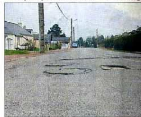
Cette plaque de béton constitue un gros danger pour L'Adert a signalé le problème en mairie en août dernier

Une pétition pour les ordures Le ramassage