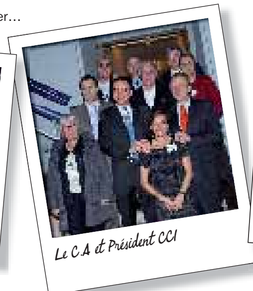
Le C.A et Président CCI