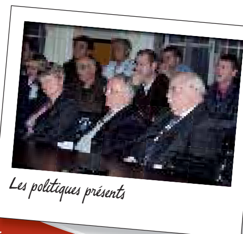
Les politiques présents