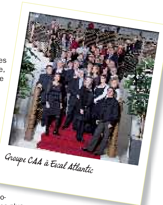
Groupe CAA à Escal Atlantic